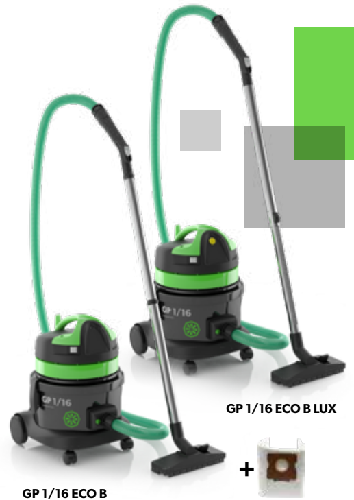
GP 1/16 ECO B