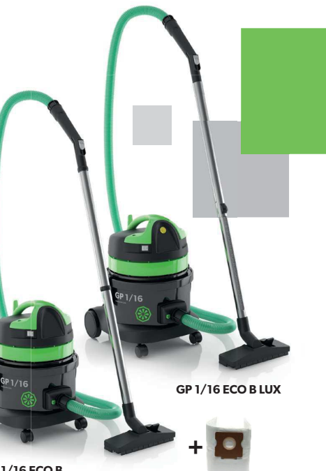
GP 1/16 ECO B