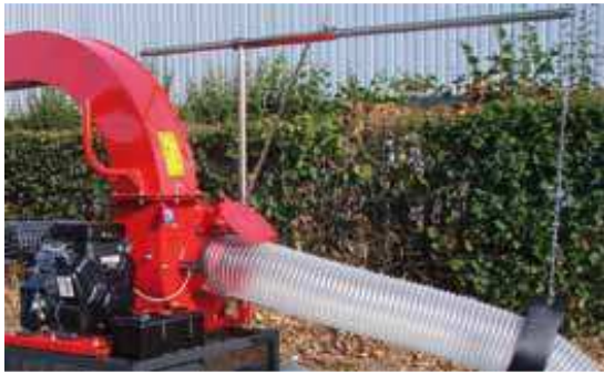
Potence de suspension de tuyau réglable