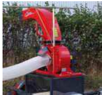
Option sur remorque très pratique : goulotte orientable sur roulement à billes avec casquette réglable (Modèle déposé)