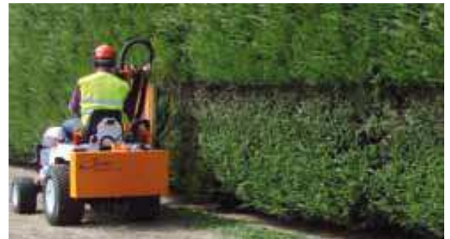
Cet aspirateur est également très efficace pour le ramassage des tailles de haie