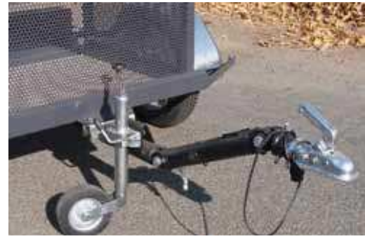
Remorque à timon réglable en hauteur