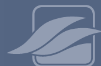
Plénum de soufflage