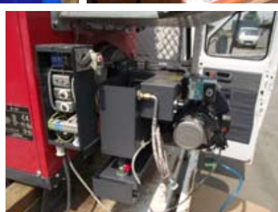
En bas : Montage non-habituel sous plafond pour gagner de place – générateur d'air chaud fixe 25S avec brûleur polycombustible KG/UB20P.